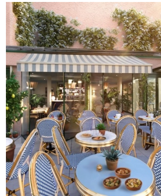
Toulouse Centre Wilson

Nouvelles adresses : l' Alfred Hotels Toulouse Centre Wilson , ouvert fin janvier 2026, propose un concept urbain autour d'un double patio végétalisé et de variations du Bleu de Lecture. Le FirstName Toulouse , installé dans le plus haut bâtiment de la ville sur les Ramblas, combine hôtel (126 chambres), résidence (102 appartements) et restaurant Le Bada.