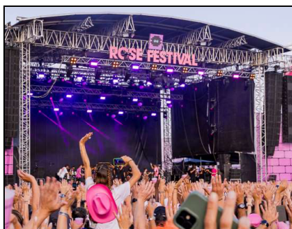
Rose Festival

Désignée Ville des musiques par l'UNESCO depuis 2023, Toulouse tient sa promesse sur le terrain cet été. Du rock à l'électro, du classique aux musiques du monde, la programmation est dense et offre de nombreuses occasions de se retrouver et de faire la fête sous le ciel toulousain.