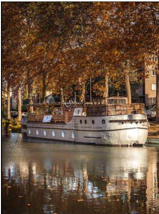
Canal du Midi

À la belle saison, les berges de la Garonne s'animent . Les guinguettes reprennent leurs quartiers d'été le long du fleuve, sur la place de la Dalbade, au Port Viguerie ou encore à bord de péniches, offrant des haltes conviviales au fil de l'eau.